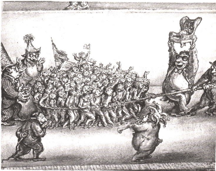
Die Abwerbung (...von A. Paul Weber)

Gut zu hören, auch wenn die Argumente von Christian Zickelbein nur schwer zu widerlegen sind: Großes Talent, große Ziele, großer Verein → HSK!